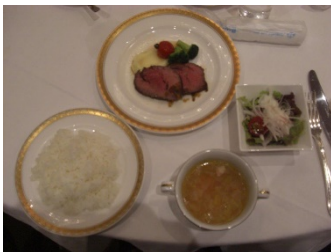
牛フィレ肉ポワレ ライス スープ サラダ