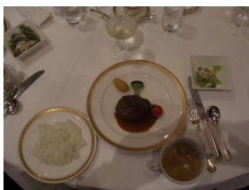
ハンバーグ サラダ スープ ライス