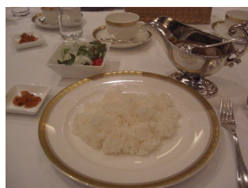
ビーフカレーライス サラダ 福神漬け