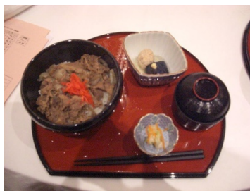
牛丼 味噌汁 お新香